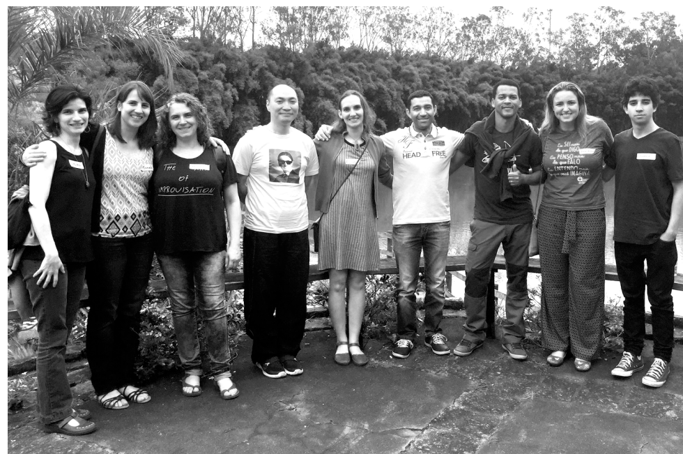
Fotografia de divulgação

Texto por Augusto Makibara e Karuã Daros